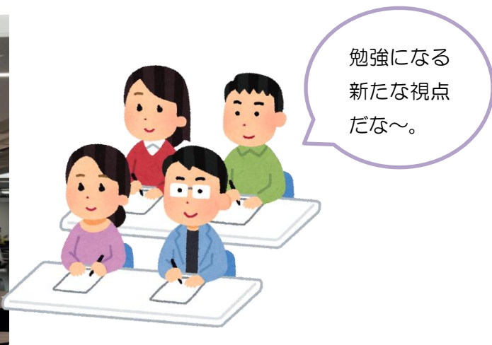
(9/26 開催の研修会の様子)