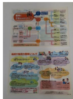
・病院・施設機能チャート クリアファイル