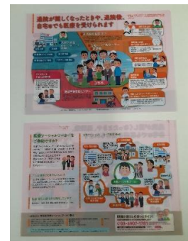
・在宅療養説明チャート クリアファイル