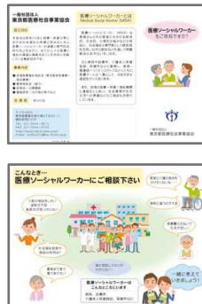
・協会パンフレット